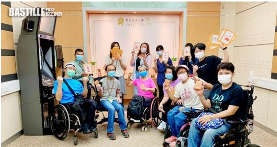
殘疾人士在新冠肺炎下更難就業。

經濟嚴峻，導致殘疾人士在就業方面難上加難。有組織進行了一項調查，發現有 3 成受訪者稱沒有就業，逾半數受訪者無法求職。而有兩成受訪者即使沒有被裁員，但有部分人仍要減薪、放無薪假等。組織擔心，現時失業率高企，再加上疫情未知何時結束的情況下，殘疾人士更難就業，組織建議政府提供更多協助，包括預留 600 個臨時職位給殘疾人士。