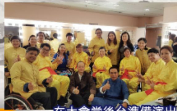
在大會堂後台準備演出