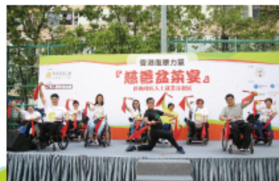
香港復康力量「排排舞」