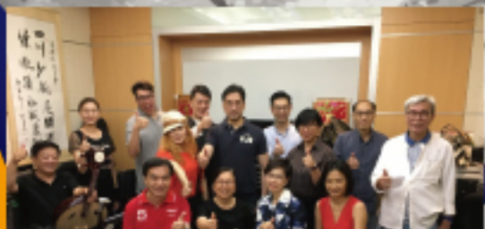
扶輪社3社 (海景驕陽, 都會及港京扶輪社) 社長及社友到香港復康力量排練合唱