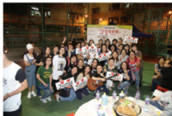
Judas Law 的fans也支持參與