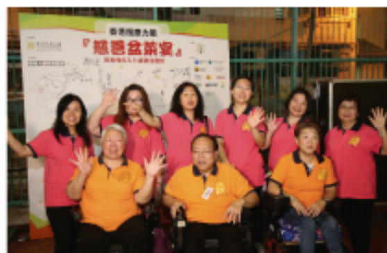
香港復康力量手語歌組