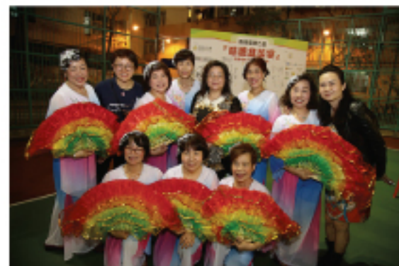
石硤尾邨居民服務中心義工舞蹈隊