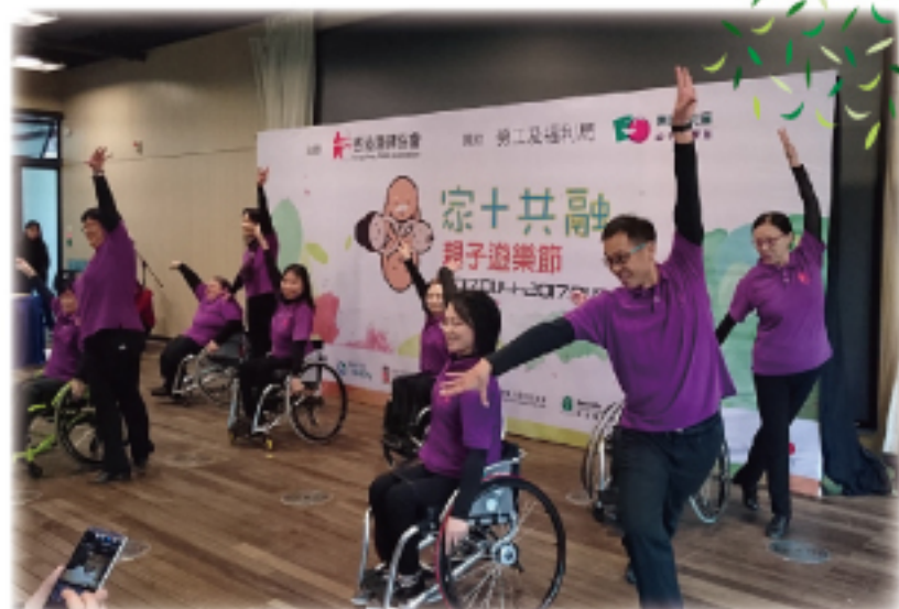
家+共融 - 親子遊樂節