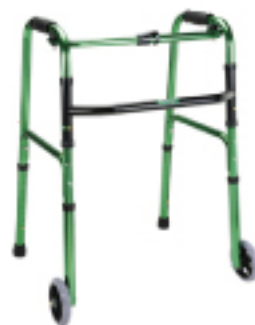
摺疊式助行架(輔助輪)