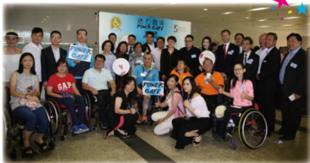
活力咖啡開幕誌慶