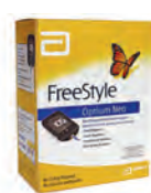
輔理善佳型至新血糖機套機