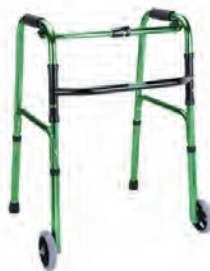
摺疊式助行架(輔助輪)