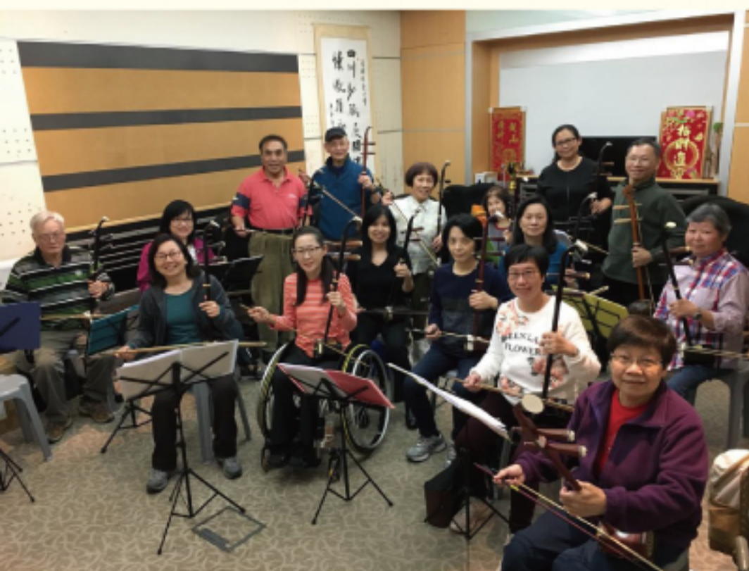
中樂團為3.29綜合音樂晚會和5.2慈善音樂會在排練